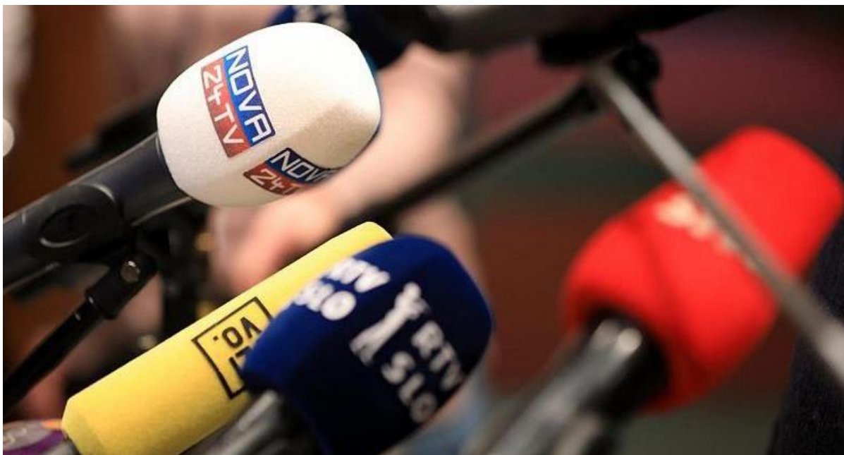
Mikrofoni na novinarski konferenci v Sloveniji.

Drugo orodje, ki se uporablja za spodkopavanje medijev, ki kritično poročajo o vladi, in za nagrajevanje provladnih medijev, je dodeljevanje državnega denarja. Na letošnjem razpisu za sofinanciranje medijskih vsebin ministrstvo za kulturo ni odobrilo financiranja dveh dnevnikov, preiskovalnih medijev in petih radijskih postaj posebnega pomena. Vladajoča stranka jih je vse pred tem označila za »levičarske« ali politično pristranske. Čeprav izguba državnega financiranja za večje medijske družbe ne predstavlja resnega finančnega udarca, je manjše radijske postaje finančno ogrozila. Med tistimi, ki so jih tokrat prvič spregledali, je Radio Študent, ena najstarejših evropskih nekomercialnih radijskih postaj. Med misijo so na Radiu Študent dejali, da bodo zaradi izgube 100.000 evrov financiranja prisiljeni v prestrukturiranje in zmanjšanje števila sodelavcev. Radio je vložil tožbo proti ministrstvu, v kateri trdi, da je bila odločitev politično motivirana in namenjena zatiranju kritičnega poročanja o vladi. Uradniki ministrstva za kulturo so povedali, da je namen sklada spodbujanje večje raznolikosti na nepristranskem trgu. Številni deležniki pa so izrazili zaskrbljenost zaradi ozkosti izbirnih meril in sistema imenovanja komisije, katere člane izbere minister za kulturo. Opazili so, da ima večina članov sedanje komisije povezave ali vezi z vlado. Med misijo so predstavniki ministrstva dejali, da je vlada med pandemijo dodelila desetine milijonov evrov koronske pomoči medijem.