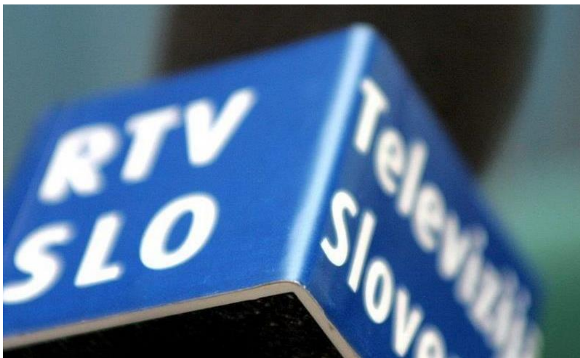
RTV SLO