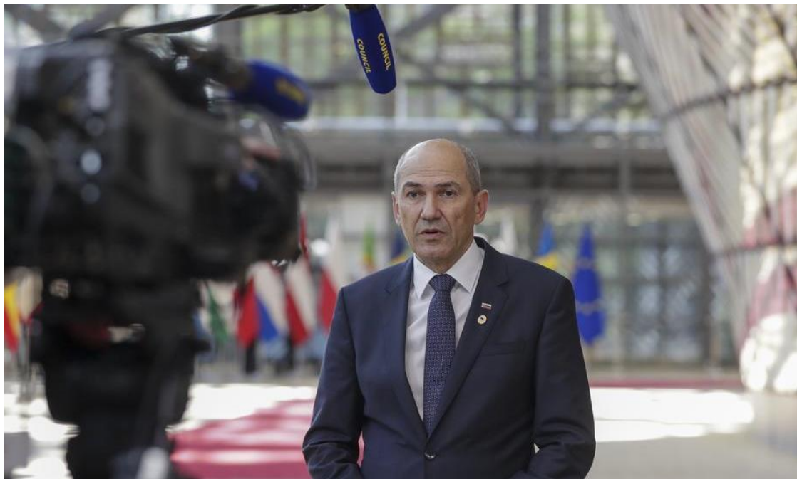
Slovenski premier Janez Janša.

pogosto demonizirajo njene kritike, vključno s predstavniki medijev. Nekateri sogovorniki so povedali, da žaljivi tviti javnih uslužbencev spodbujajo vedno bolj strupeno javno razpravo in poglobljajo polarizacijo v novinarski skupnosti.