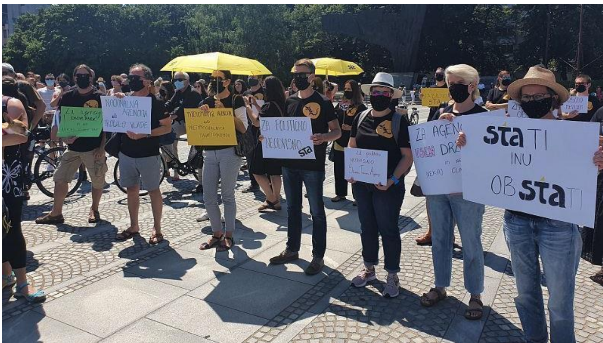
Protest v Ljubljani zaradi prekinitve financiranja STA, julij 2020.